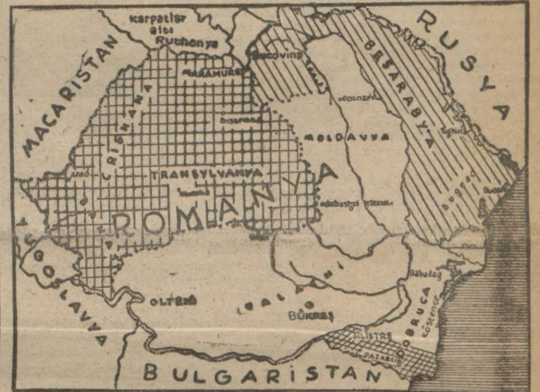
Sovyetlerin işgal ettikleri arazi ile Macar ve Bulgarların talep ettikleri arazi gösterir harita

Yeni Sovyet - Rumen hududu tahdid ediliyor