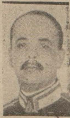
Macar hariciye nazırı Şaki

ber olduğu ve ileride bu ilhakın hesabını Moskovadan soracağı yolunda tehdidde bulunduğu dair verilen bazı haberler, sa (Devamı 7 nci sayfa)