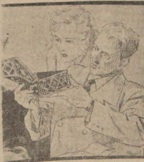
Romanın kahramanlarından polis müdürü Brusso

Son senelerin en güzel zabita romanlarından biri Yarın başlıyoruz